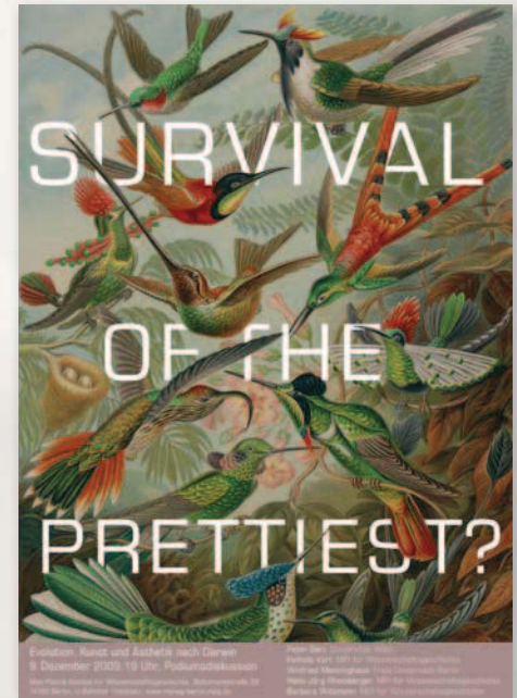
v.l.: Siegerbeitrag "Podium – Junges Europäisches Musikfestival, Spezialpreis-Gewinner Ballhaus Naunynstraße, erstes eingereichtes Plakat des Wettbewerbs vom Max-Planck-Institut