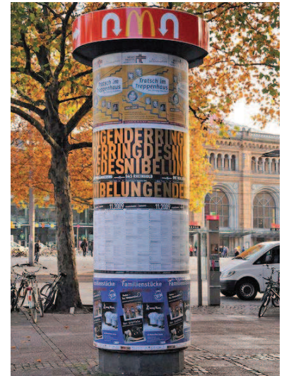
Schauspiel und Staatsoper Hannover reichten eine Ringlebung ein

weisen. Ebenso das Gerhard-Hauptmann-Theater Zittau konnte mit seinen eher traditionellen, aber ansprechenden Theaterplakaten viele Stimmen auf sich vereinen. Überraschend auf Platz 2 positionierte sich das durch Deutschland tourende Musical "The Rock 'n' Roll Wrestling Bash High Voltrash", welches in der Tat ein ganz eigenes Konzept verfolgt und durch die markante Zeichnung einen den gängigen Schönheitsvorstellungen widersprechenden, aber stimmigen Gesamteindruck vermittelt.