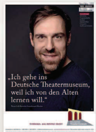
v.l.: Zwei von fünf Motiven des staatlichen Textilmuseums Augsburg, Motive aus Plakatreihen des Badischen Landesmuseums Augsburg und des Deutschen Theatermuseums