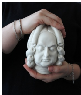
Johann Sebastian Bach (1685–1750) Miniaturbüste von Luigi Colani (*1928) Biskuitporzellan, 1985