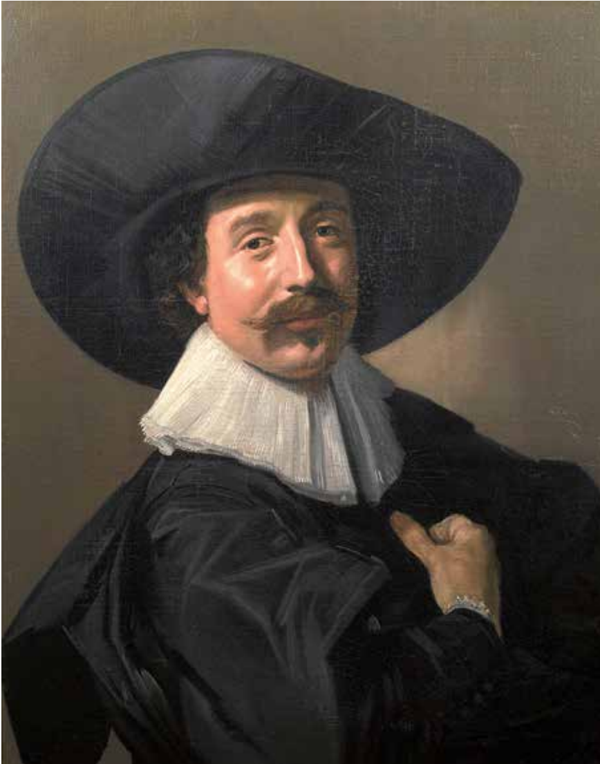
Abb. 13 Frans Hals, Brustbild eines unbekanntem Herrn mit Hut und Hand- schuhen, um 1535

Vergleichssumme wurde dem Anwalt der Erbengemeinschaft angeboten und die Einschätzung der eigenen rechtlichen Position deutlich gemacht: Die Anbieter hätten nie Eigentum erworben, da sie immer von der Herkunft aus einem Diebstahl wussten, die »Vereinbarung« sei so nicht wirklich wirksam und zudem seien Besitzer und Eigentümer nun identisch. Eine telefonische Kontaktaufnahme der EvSK direkt mit dem nach Berlin gekommenen Vertreter der Erbengemeinschaft wurde durch deren Anwalt abgeblockt. Die über Mail, Telefon, Briefe und schließlich in großer Runde in Gotha geführten Verhandlungen liefen sich fest – der Anwalt und anscheinend auch seine Mandanten waren nicht an einer gütlichen Einigung auf einem niedrigerem finanziellen Niveau interessiert.