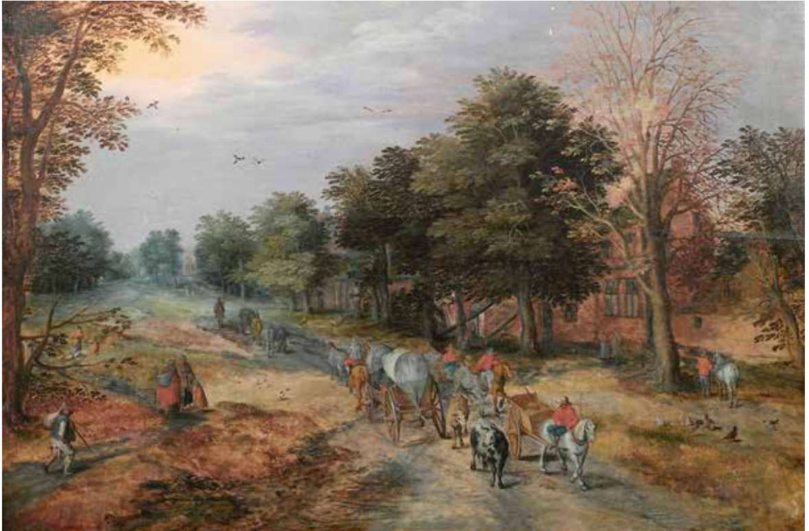
Abb. 12 Jan Brueghel d. Ä. (Werkstatt?), Landstraße mit Bauernwagen und Kühen, um 1610