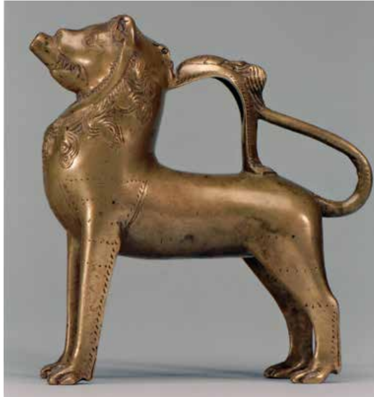
Abb. 5 Löwenaquamanile, Thüringen, frühes 14. Jahrhundert