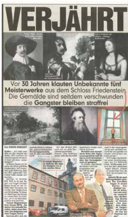
Abb. 10 BILD vom 11.12.2009