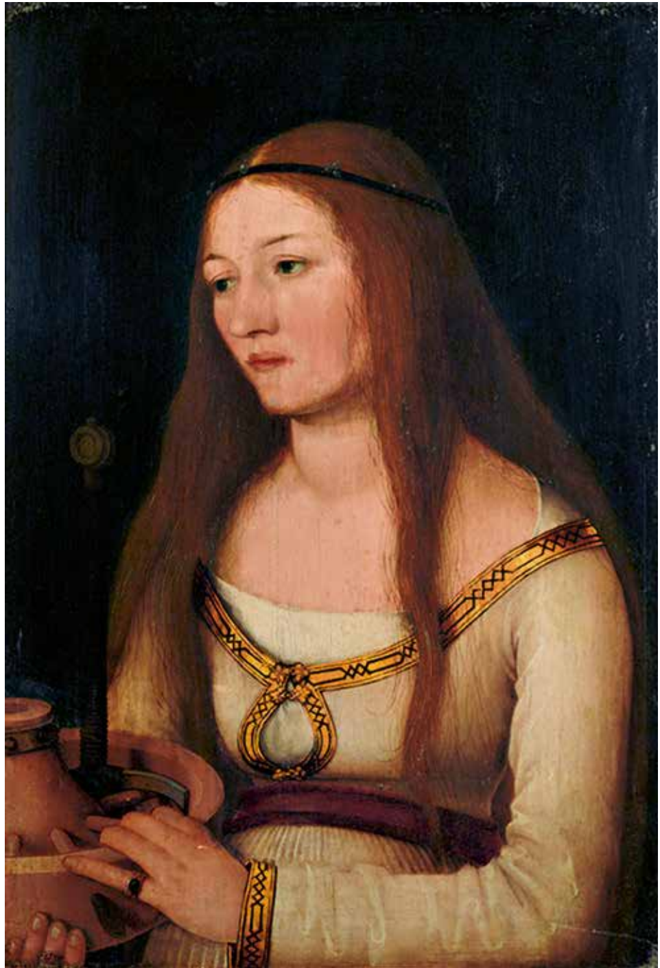
Abb. 11 Hans Holbein d. Ä., Heilige Katharina, um 1510

Sein Vater habe in russischer Kriegsgefangenschaft einen »Hans« kennengelernt, der später nach Australien ausgewandert sei. Der Sohn dieses »Hans« sei in der DDR inhaftiert worden. Daraufhin habe sein Vater, so der Unbekannte, eine Million Mark aus einer Erbschaft gezahlt, um den Mann freizukaufen. Es bleibt offen, an wen. Im Gegenzug habe er die Bilder als Sicherheit erhalten.« 27