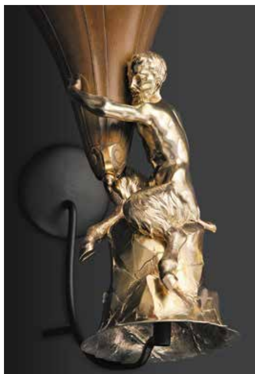
Abb. 8 Elias Adam, Rhinoceros- hornbecher mit Fuß in Gestalt eines Satyrs, Augsburg, Anfang 18. Jh.