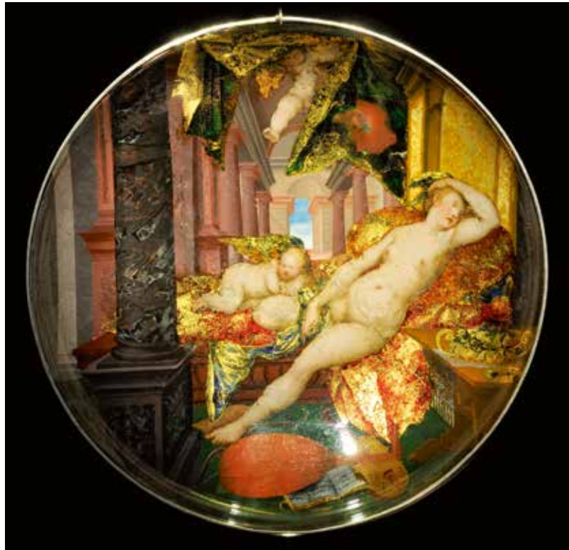
Abb. 4 Hans Jakob Sprüngli, Doppelwandschale mit Darstellung der schlafenden Venus, Zürich, um 1610-20

Die kriminalistische Rekonstruktion des nächtlichen Einbruchs, die umfangreichen Ermittlungen von Volkspolizei und Staats-sicherheitsdienst sind mangels echter Aufklärung des Falles mehrfach und detailliert geschildert worden, sogar ein Kriminalroman und Filmbeiträge erschienen. 13 Deshalb nur kurz die Fakten: In der Nacht zum 14. Dezember 1979 wurden fünf Altmeistergemälde aus der im zweiten Obergeschoss des Gothaer Schlosses gelegenen Gemäldesammlung entwendet. Es handelt sich – so die heute korrekte kunsthistorische Einordnung durch die von der EvSK bestellten wissenschaftlichen Fachgutachter 14 – um eine »Heilige Katharina« von Hans Holbein d.Ä., eine »Landstraße mit Bauernwagen und Kühen« aus der Werkstatt Jan Brueghels d.Ä., das »Brustbild eines unbekanntenen Herren mit Hut und Handschuhen« von Frans Hals, eine historische Kopie nach dem »Selbstbildnis mit Sonnenblume« von Anthonis van Dyck und das »Bildnis eines alten Mannes« vom Rembrandtschüler Ferdinand Bol (Abb. 11 – 15). Unmittelbar nach dem Diebstahl wurde deren Wert von den Ermittlungsbehörden mit 4,53 Millionen »Ostmark« 15 dokumentiert. In den jüngeren Presseberichten stieg ein ohne Grundlage angenommener Schätzwert allerdings bis auf 50 Millionen Euro und diese nur gegriffene Summe verfestigte sich schließlich