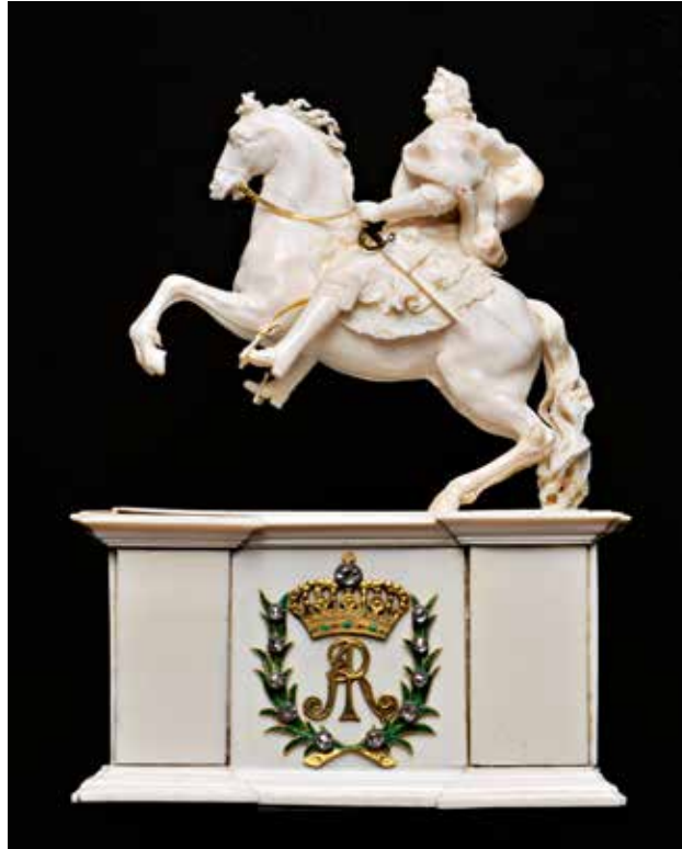
Abb. 2 (rechts) Reiterstatuette Augusts des Starken, Dresden, um 1715/20

und durch Diebstähle oder widerrechtliche Entnahmen große Verluste zu verzeichnen. Aber immer wieder gelangen spektakuläre Rückerwerbungen. Bei einer Elfenbeinstatuette August des Starken 5 (Abb. 2), dem »Gothaer Elefanten« (Abb. 3) – ein barockes Trinkspiel 6 –, und der kostbaren Sprüngli-Schale 7 (Abb. 4), erfolgten sie gemeinsam mit der Kulturstiftung der Länder, dem Bund, dem Land Thüringen oder weiteren Stiftungen, wie der Rudolf-August Oetker-Stiftung. Immer wieder förderte die EvSK auch alleine, wie beim Rückerwerb eines Löwenaquamaniles des frühen 14. Jahrhunderts 8 (Abb. 5) oder dem Porträt des burgundischen Herzogs Philipp des Guten aus der Nachfolge des Rogier van der Weyden 9 (Abb. 6). Beim Wiederankauf der wertvollsten Teile der einzigartigen Gothaer Münzsammlung 10 (Abb. 7), die nach Kriegsende nach Coburg verbracht worden waren, führte Martin Hoernes – damals noch für die Kulturstiftung der Länder – die komplizierten Verhandlungen mit dem Haus Sachsen-Coburg und Gotha. Die EvSK finanzierte damals den Landesanteil des Kaufes vor. Eine weitere Vorfinanzierung für die Kulturstiftung der Länder ermöglichte 2007 den Rückerwerb eines Rhinozeroshornbechers 11 (Abb. 8). Es bestanden also enge und tragfähige persönliche Verbindungen der Ernst von Siemens Kunststiftung nach Gotha, auf die Oberbürgermeister Kreuch bauen konnte.