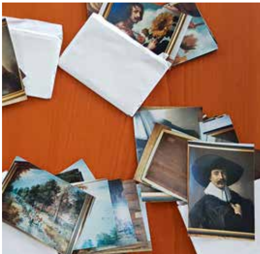
Abb. 9 Briefumschläge mit den ersten Farbfotos der gestohlenen Gemälde