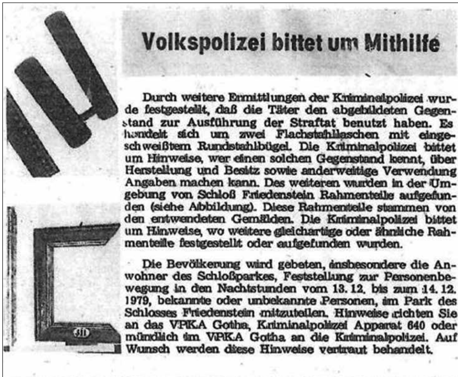
Abb. 17 Thüringer Landeszeitung vom 18.12.1979