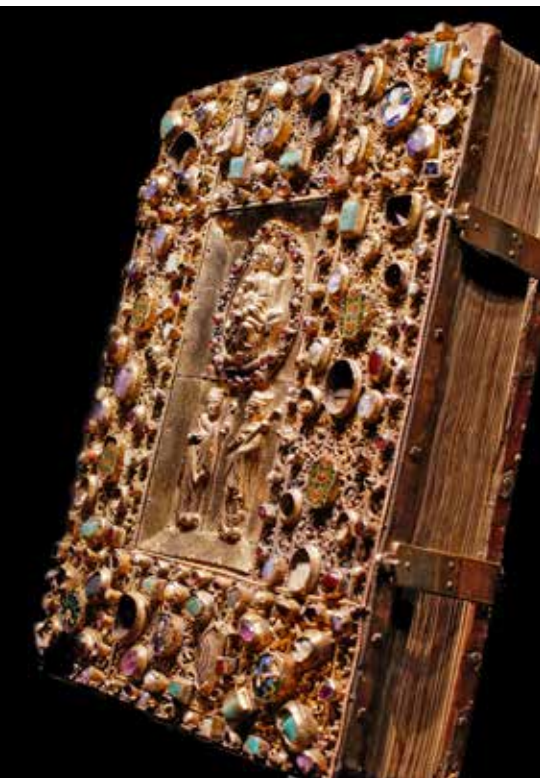
Abb. 20 Samuhel-Evangelium, Domschatz Quedlinburg

effektive Unterstützung für Gotha, die nötige Diskretion zu wahren, professionell und Schritt für Schritt vorzugehen, um die Bilder auf alle Fälle an ihren historischen Ort zurückzubringen und wenn nötig, für die finanziellen Risiken einzustehen.