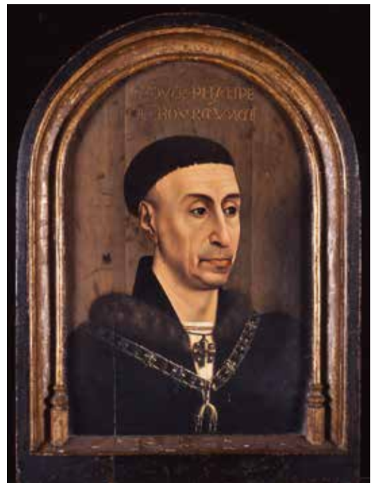
Abb. 6 Rogier van der Weyden zugeschrieben, Herzog Philipp der Gute von Burgund, um 1450

Die kriminalistische Rekonstruktion des nächtlichen Einbruchs, die umfangreichen Ermittlungen von Volkspolizei und Staats-sicherheitsdienst sind mangels echter Aufklärung des Falles mehrfach und detailliert geschildert worden, sogar ein Kriminalroman und Filmbeiträge erschienen. 13 Deshalb nur kurz die Fakten: In der Nacht zum 14. Dezember 1979 wurden fünf Altmeistergemälde aus der im zweiten Obergeschoss des Gothaer Schlosses gelegenen Gemäldesammlung entwendet. Es handelt sich – so die heute korrekte kunsthistorische Einordnung durch die von der EvSK bestellten wissenschaftlichen Fachgutachter 14 – um eine »Heilige Katharina« von Hans Holbein d.Ä., eine »Landstraße mit Bauernwagen und Kühen« aus der Werkstatt Jan Brueghels d.Ä., das »Brustbild eines unbekanntenen Herren mit Hut und Handschuhen« von Frans Hals, eine historische Kopie nach dem »Selbstbildnis mit Sonnenblume« von Anthonis van Dyck und das »Bildnis eines alten Mannes« vom Rembrandtschüler Ferdinand Bol (Abb. 11 – 15). Unmittelbar nach dem Diebstahl wurde deren Wert von den Ermittlungsbehörden mit 4,53 Millionen »Ostmark« 15 dokumentiert. In den jüngeren Presseberichten stieg ein ohne Grundlage angenommener Schätzwert allerdings bis auf 50 Millionen Euro und diese nur gegriffene Summe verfestigte sich schließlich