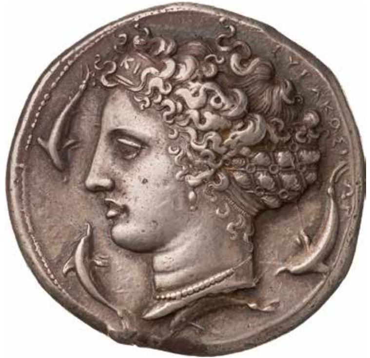
Abb. 21 Dekadrachme von Syrakus, Signatur des Kimon