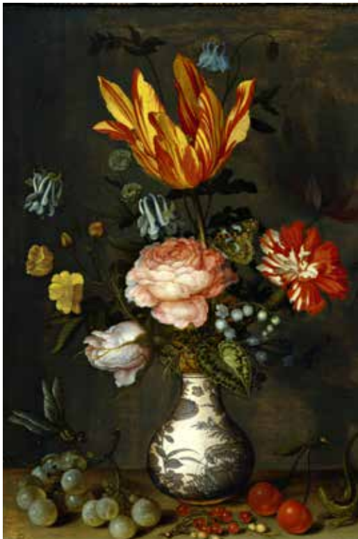
Abb. 22 Balthasar van der Ast, Blumenstrauß, 1628

Vielleicht sind sich manche Käufer auch heute nicht immer über die Herkunft eines zu erwerbenden Werkes im Klaren und deshalb bereit, einen hohen Liebhaberpreis zu zahlen – für ein Stück, mit dessen krimineller Herkunft sie eigentlich nichts zu tun haben wollen und dessen Wiederverkaufsmöglichkeiten deshalb natürlich deutlich eingeschränkt sind. Im professionellen Kunsthandel sind heutzutage gestohlene Werke nicht mehr zu verkaufen, da Datenbanken und das Internet zahllose Recherchemöglichkeiten bieten.