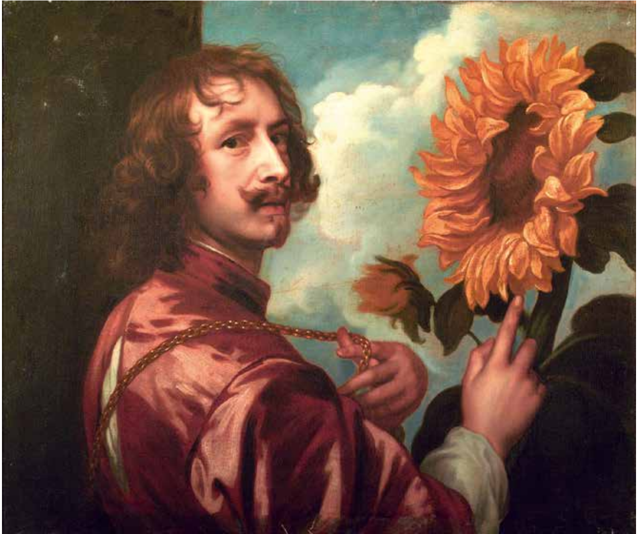
Abb. 14 Unbekannter Künstler nach Anthonis van Dyck, Selbstbildnis mit Sonnenblume, nach 1633

der Alten Meister« 28 (Abb. 23) eine gemeinsame Pressemitteilung, um ihr eigenes Handeln und die entstandene rechtliche Situation öffentlich verständlich zu machen. 29 Die nächsten Tage stand zumindest Thüringen Kopf. Der »größte Kunstraub der DDR« anscheinend aufgeklärt, die verschwundenen Bilder wiederaufgetaucht. Aber Fragen über Fragen – die niemand beantworten konnte oder wollte, denn die Verhandlungen waren noch offen, die rechtliche Situation noch nicht allseits akzeptiert und die Authentizität der Bilder noch nicht abschließend geprüft.