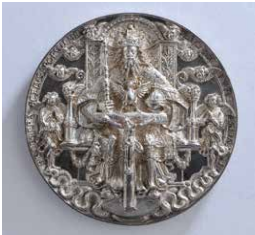
Abb. 7 Hans Reinhart d. Ä., Dreifaltigkeitsmedaille, 1544

Zurück zu den aus dem Nichts aufgetauchten Farbfotos auf dem Erfurter Hoteltisch – fast 40 Jahre nach dem Verschwinden der Gemälde (Abb. 9). OB Knut Kreuch hatte lange auf einen solchen Moment gehofft. Für ihn als leidenschaftlichen Kulturpolitiker und engagierten Kämpfer für Gotha war klar: Er würde alles tun, um die Kunstwerke zurück zu bringen, deren Diebstahl ihn als kleiner Junge in der von sichtbarer Kriminalität verschonten DDR schockiert hatte. 20 Die Angelegenheit vertrug keine Öffentlichkeit, denn es galt zunächst vor allem zu verhindern, dass das Gothaer Diebesgut wieder abtauchte und so blieb die Ernst von Siemens Kunststiftung mit ihrem Generalsekretär Martin Hoernes lange der einzige Mitwisser der unglaublichen neuen Entwicklung.