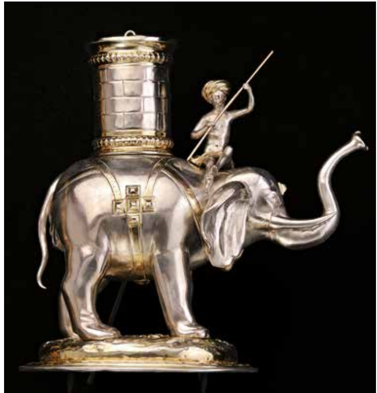
Abb. 3 Simon Wickert, Trinkgeschirr in Gestalt eines Elefanten, Augsburg, um 1699/1700