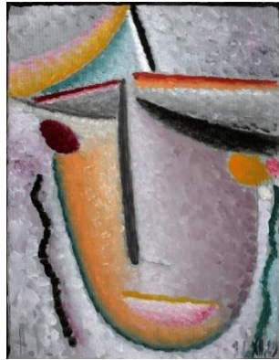
Alexej von Jawlensky: Abstrakter Kopf: Gelbes Licht

HIER UND JETZT! DIE SAMMLUNG HORN ZU GAST IN DORTMUND