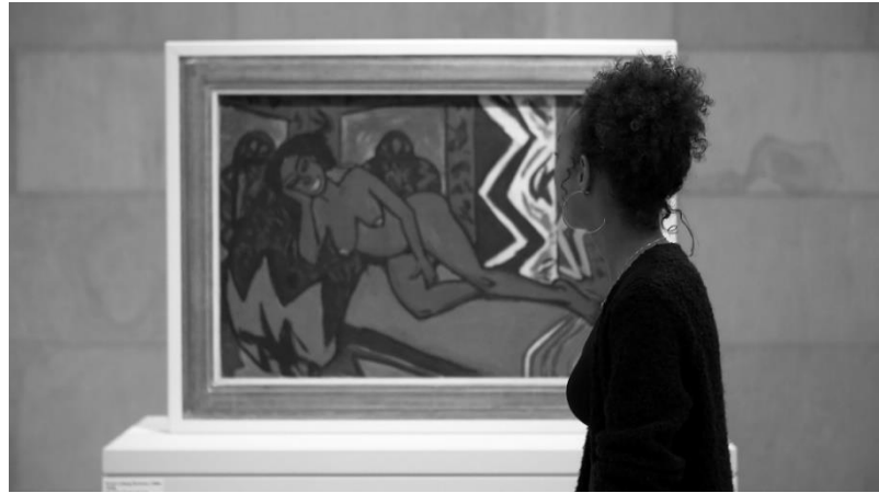
Filmstill aus „ Millis Erwachen “ Ein Film von Natasha A. Kelly kommissioniert von der 10. Berlin Biennale 2018.