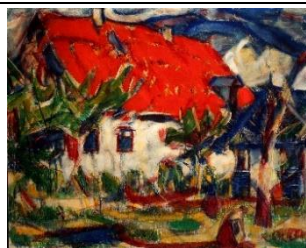
Christian Rohlf: Haus in Soest

1916, Tempera auf Leinwand, 100 x 120 cm