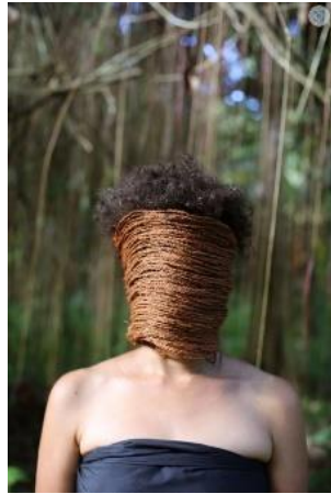
Lisa Hilli: In a Bind 2015, Pigmentdruck, Maße variabel © Lisa Hilli

HIER UND JETZT! DIE SAMMLUNG HORN ZU GAST IN DORTMUND