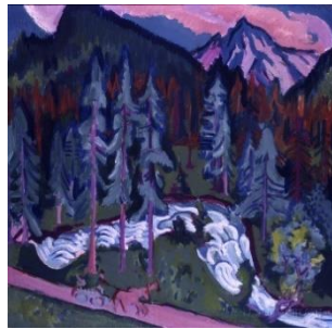
Ernst Ludwig Kirchner: Sertigweg

1924/26, Öl auf Leinwand, 145,5 x 145,5 cm