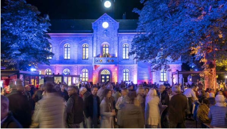
Das illuminierte Kunstforum Ingelheim - Altes Rathaus am François-Lachenal-Platz in Nieder-Ingelheim

Zum 20. Mal laden Boehringer Ingelheim und die Internationalen Tage als Veranstalter und Organisatoren am Freitag, 10. Juni wieder zur Nacht der Kunst ein, einem beliebten Treffpunkt für Kunstfreunde und Nachtschwärmer. Das populäre Fest findet von 19 bis 24 Uhr auf dem François-Lachenal-Platz vor dem Kunstforum Ingelheim - Altes Rathaus in Nieder-Ingelheim statt.