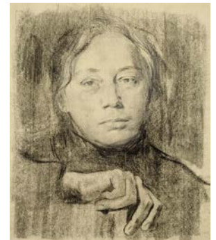
Käthe Kollwitz, Selbstbildnis mit aufgestütztem Arm, 1905, Hamburger Kunsthalle

Die nächste Ausstellung der Internationalen Tage Ingelheim ist für das Frühjahr 2022 geplant und findet vom 1. Mai bis zum 17. Juli statt. Das Thema der kommenden Schau wird zeitnah bekannt gegeben.