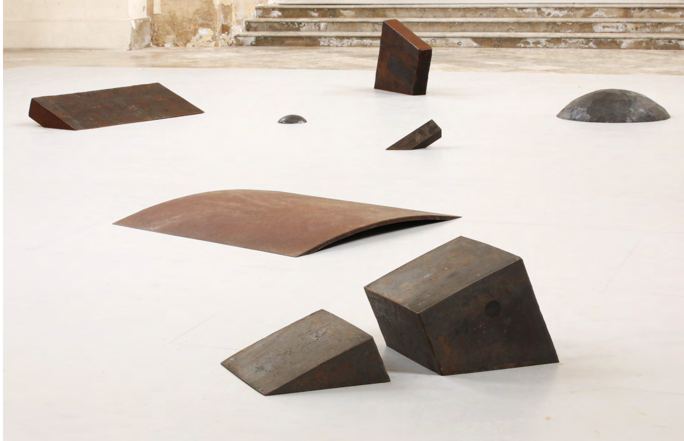
Alf Lechner, Versinkende Körper, 1984-86, Stahl massiv, geschmiedet, gesägt

In seinem Werk geht es Lechner immer wieder um das Verhältnis von Technik und Kunst, von Rationalität und Emotionalität, von Reflexion und Prozess, von Kalkül und Zufall.