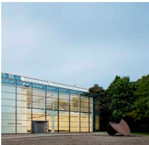
LECHNER MUSEUM Ingolstadt