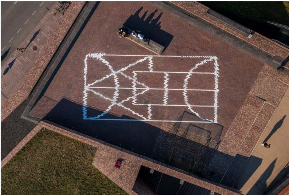
Matt Mullican: FIVE WORLD CHART ON BRICK, Terrasse Europäisches Hanseum Lübeck

Die temporäre Kreidearbeit von Matt Mullican auf der Terrasse des Hanseums interpretiert Formen der dort vorgefundenen Backsteine und interagiert mit dem städtischen Umfeld.