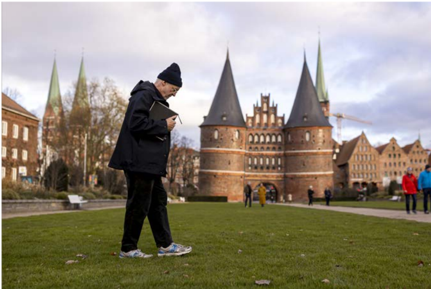
Matt Mullican

Im November 2021 besuchte der Künstler erstmals die Hansestadt.