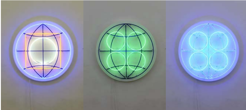
Matt Mullican: Ohne Titel, 2017, Set von 3 Neons auf Plexiglas montiert

Possehl-Preis für Internationale Kunst 2022