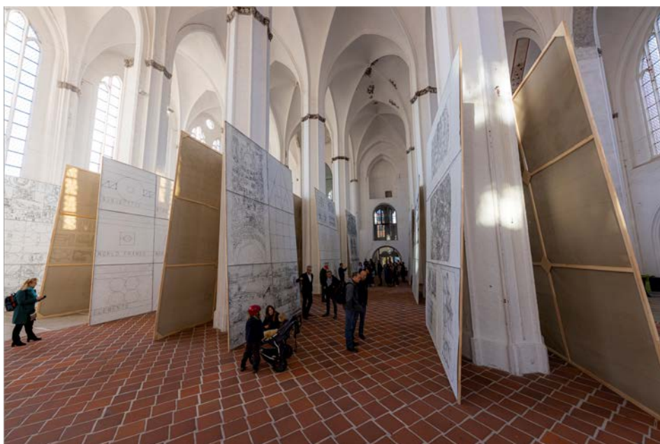
Matt Mullican: CHURCH

Die monumentale Installation, „Berlin-Block“ von Matt Mullican, die im Kirchenraum von St. Petri unter dem Titel CHURCH präsentiert wird, besteht aus 169 großflächigen Leinwänden.