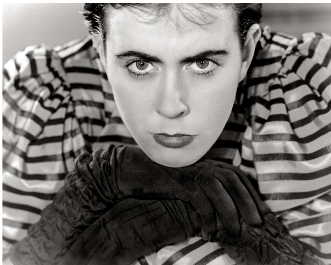
Eva Besnyö, Narda, Amsterdam 1937, Silbergelatine

Fesselnde Blicke, überraschendes Licht und ungewohnte Perspektiven – die Photographien von Eva Besnyö (1910–2003) faszinieren. Im Rahmen des Festivals der Internationalen Photoszene Köln und der photokina 2018 setzt das Käthe Kollwitz Museum Köln seine Photo-Reihe fort und präsentiert an die 100 Werke dieser außergewöhnlichen Photographin aus sechs Jahrzehnten.