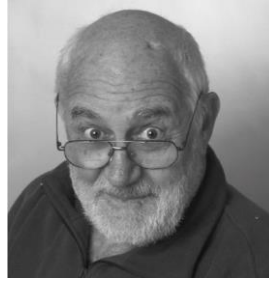
Friedrich Kracht.