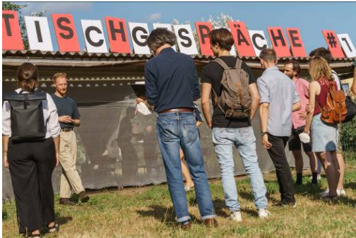
Campus Zukunft Wohnen. Luckenwalde, August 2021. Abschlusspräsentation: Tischgesellschaft e. V.

Lösungsansätze entwickelt, die in den nachfolgenden Tagen bearbeitet und immer weiter präzisiert wurden. Sie mündeten zum Ende des Workshops in vier performativen Abschlusspräsentationen: „Polytopie & Assemblage“, „Wir gegen den Markt“, „Der Zaun im Kopf“ und „Tischgesellschaft e. V.“.