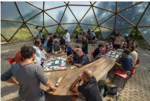
Campus Zukunft Wohnen. Luckenwalde, August 2021. Abschlusspräsentation: Wir gegen den Markt.

Die zehnte ZukunftsWerkstatt der Wüstenrot Stiftung fand vom 6. bis 15. August 2021 im E-Werk im brandenburgischen Luckenwalde statt. Zentrales Thema des Campus Zukunft Wohnen war die titelgebende Frage nach der Zukunft des Wohnens. Wie sieht sie aus? Welche Entwicklungen werden bestimmend, welche Faktoren prägend sein? Wie stellen sich junge Fachleute das Wohnen der Zukunft vor, das sie selbst gestalten und erleben werden? Welche realisierbare Utopie, welche konkretisierbaren Visionen wartet auf uns?