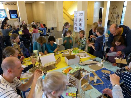
StadtbauAkademie: Hausforschertage.

Architektur und öffentlicher Raum sind alltägliche Begleiter und beeinflussen unser Leben in der Stadt auf direkte Weise. Oft nehmen wir diese gebaute Umwelt wenig wahr. Wissen über Prozesse in der Stadtgestaltung und -planung bilden jedoch die Grundlage, um die Stadt der Zukunft mitzugestalten. Aus diesem Grund ging im Mai 2018 mit der StadtbauAkademie ein deutschlandweit einmaliges Projekt an den Start: ein Kompetenzzentrum für baukulturelle Bildung in Stuttgart als Kooperation zwischen der Wüstenrot Stiftung und dem StadtPalais – Museum für Stuttgart.