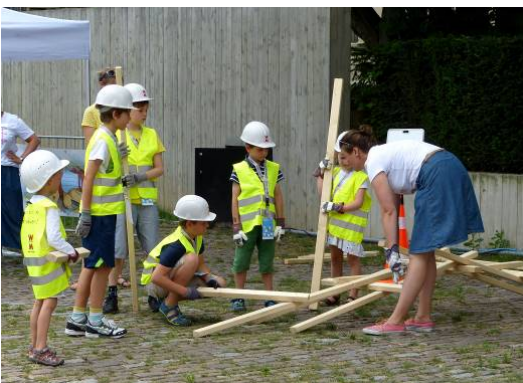
StadtbauAkademie: BauFest .

Am 9. Oktober fällt im StadtPalais – Museum für Stuttgart der Startschuss für ein abwechslungsreiches Kinderfestival mit vielen spannenden Aktionen. Gefei­ert werden 10 Jahre StadtLabor, der Familientag der StadtbauAkademie und das Highlight: Die Neueröffnung der Kinderbaustelle. Die StadtbauAkademie ist ein Kompetenz­zentrum für Architekturvermittlung, das als Kooperation zwischen dem StadtPalais – Museum für Stuttgart und der Wüstenrot Stiftung durchgeführt wird.