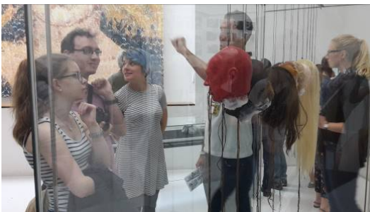
FSJ Kultur-Bildungsexkursion zur documenta 14 in Kassel.

Für die Wüstenrot Stiftung sind der Erhalt und die Förderung des kulturellen Erbes zentrale Anliegen. Was liegt näher, als auch junge Erwachsene für diese Aufgabe zu begeistern? Im Rahmen ihres praxisorientierten Ansatzes legt die Stiftung einen Schwerpunkt auf die Ermöglichung eines Freiwilligen Sozialen Jahres Kultur, das Menschen zwischen 16 und 26 Jahren Einblicke in kulturelle Einrichtungen der Region und ihrer Arbeit bietet. Nach Schule oder Ausbildung können diese sich ein Jahr lang kulturell engagieren und diese bildungs- und erfahrungsreiche Zeit zur persönlichen Weiterbildung sowie zur Orientierung, Studien- und Berufsvorbereitung nutzen.